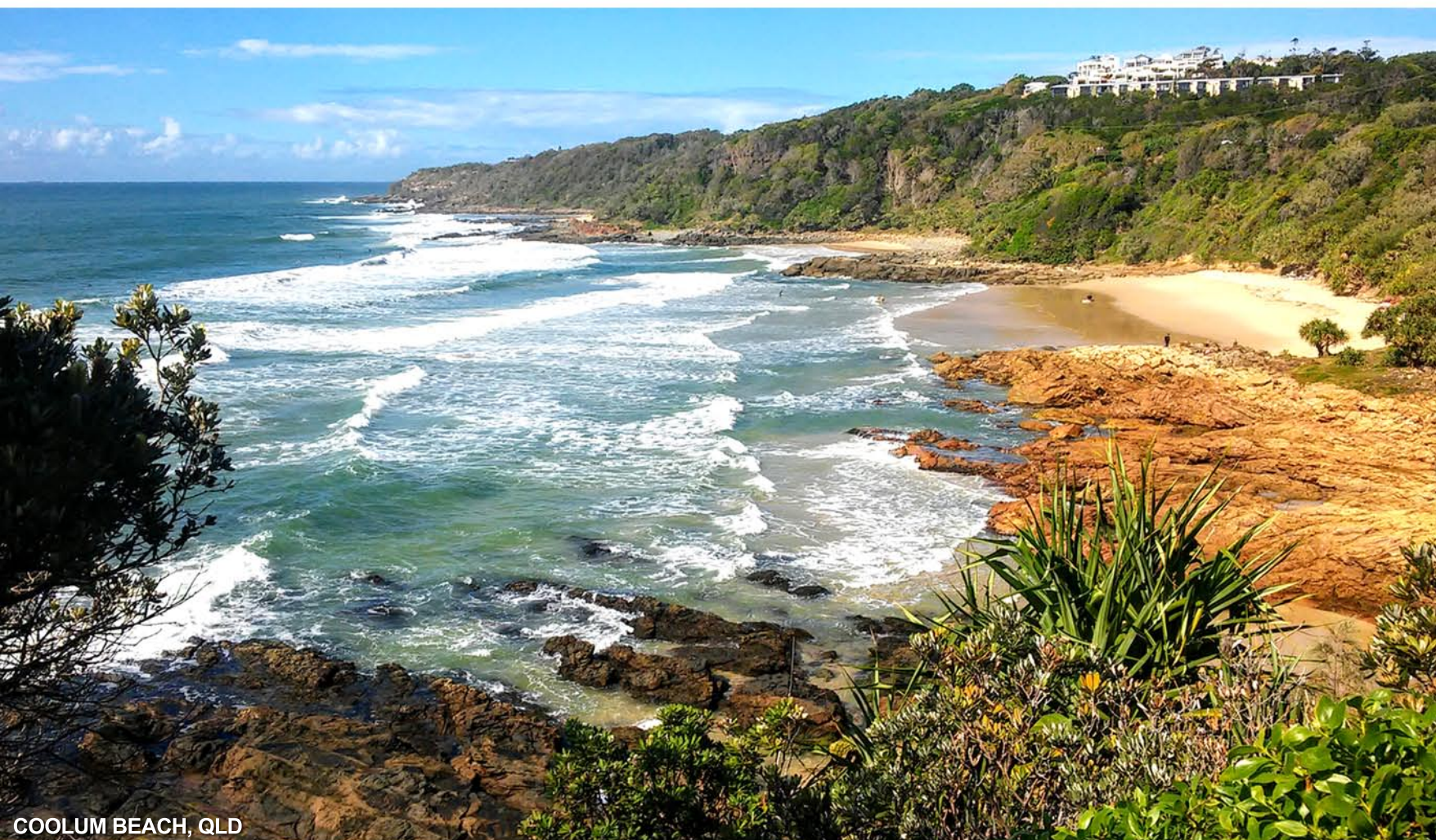
COOLUM BEACH, QLD

aquaprojekt@poczta.onet.pl www.aquaprojekt.lodz.pl